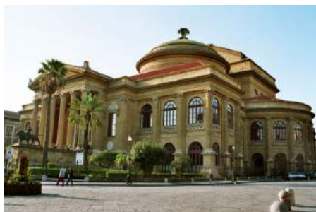
Théâtre Massimo – Palerme