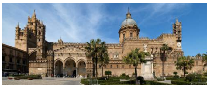
Cathédrale – Palerme