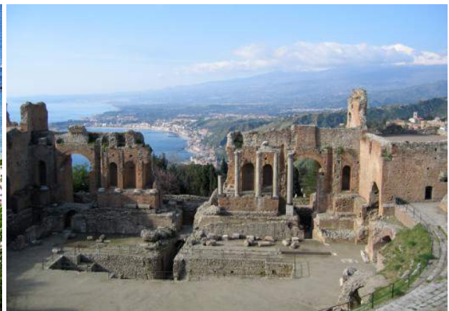
Théâtre Grec - Taormina