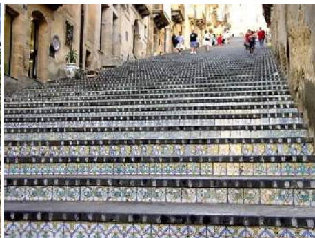
Escalier - Caltagirone