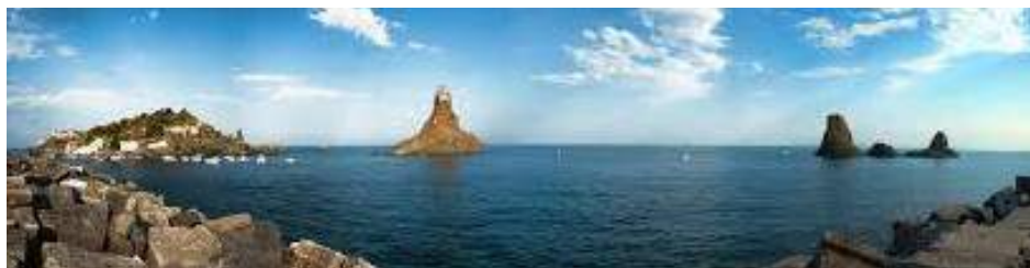
Côte des Cyclopes

Prix par personne en chambre double € 1530,00