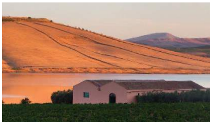
Établissement vinicole UlmoPlaneta – Sambuca di Sicilia