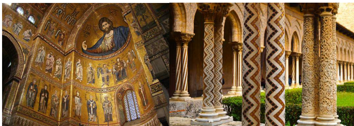
Cathédrale - Monreale