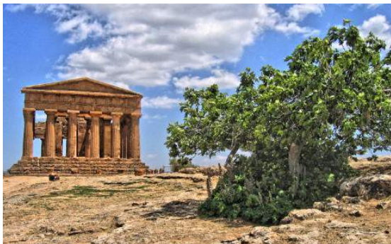
Vallée des Temples – Agrigento

Arrivée à Randazzo en fin d'après-midi. Dîner et nuit à l'hôtel Feudo Vagliasindi*** , au pied du Volcan Etna .