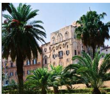
Palais Royal – Palerme