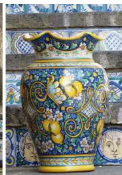
Poterie - Caltagirone