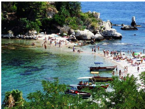
Belle île - Taormina