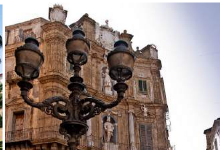
Quattro Canti - Palerme