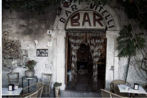
Bar Vitelli - Savoca