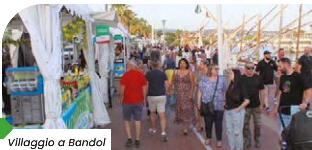
Villaggio a Bandol