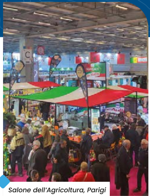
Salone dell'Agricoltura, Parigi