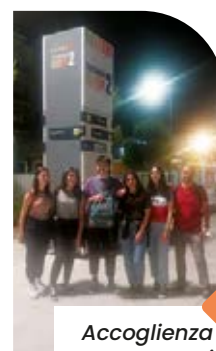
Accoglienza ragazzi Liceo Capece