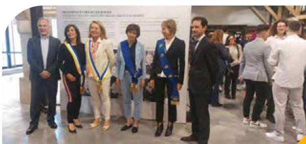
Incontri tra studenti delle Bocche del Rodano e di Genova, al Camp des Milles, nell'ambito dell'Accordo di Cooperazione decentralizzata tra CD13- Città Metropolitana di Genova e Comune di Genova