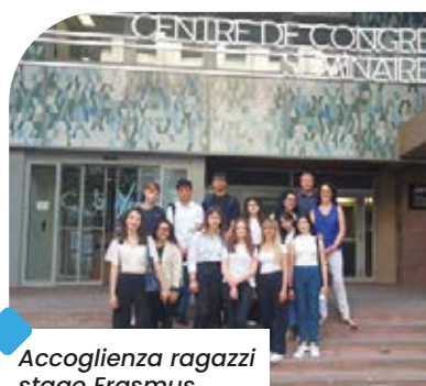
Accoglienza ragazzi stage Erasmus Lepido Rocco

Nell'ambito di questi progetti gli alunni beneficiano di stage in azienda, in diversi settori di attività quali la ristorazione, l'amministrativo, il marketing, la comunicazione, il turismo.