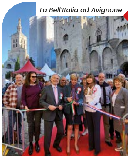
La Bell'Italia ad Avignone