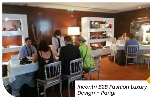
Incontri B2B Fashion Luxury Design - Parigi