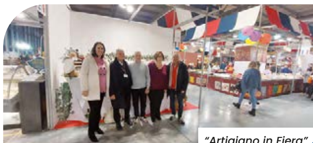
"Artigiano in Fiera" a Milano