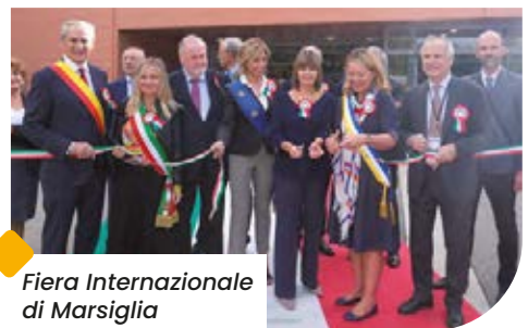
Fiera Internazionale di Marsiglia