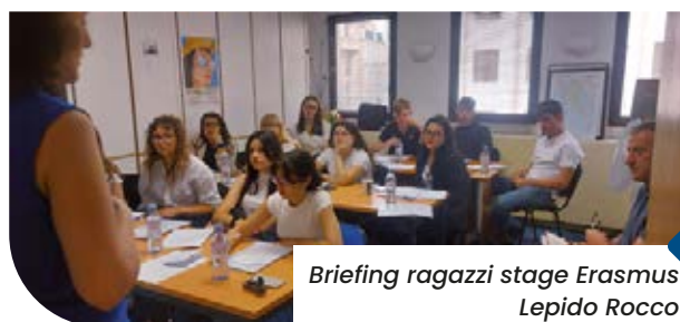
Briefing ragazzi stage Erasmus Lepido Rocco