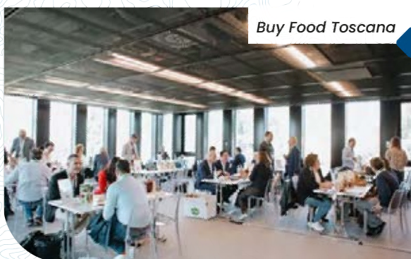
Buy Food Toscana