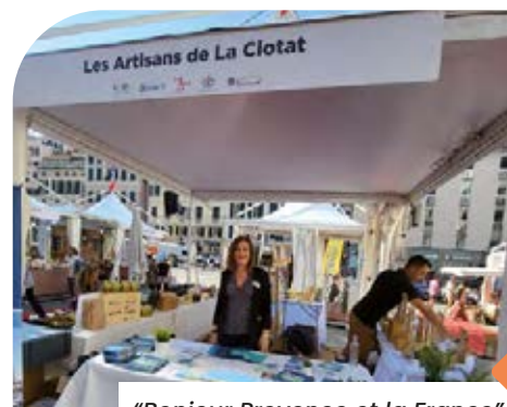
"Bonjour Provence et la France" a Genova