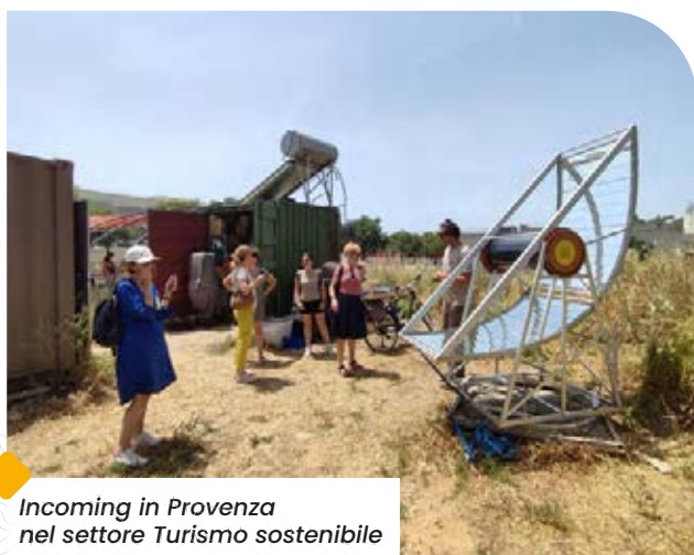
Incoming in Provenza nel settore Turismo sostenibile

VII - Webinars innovativi declinati sul format di "Export Hub Italia- Francia": presentazioni delle opportunità di business per le aziende italiane nei settori d'investimento francesi in collaborazione con le agenzie di sviluppo territoriali