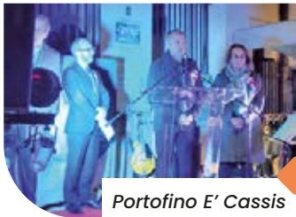
Portofino E' Cassis