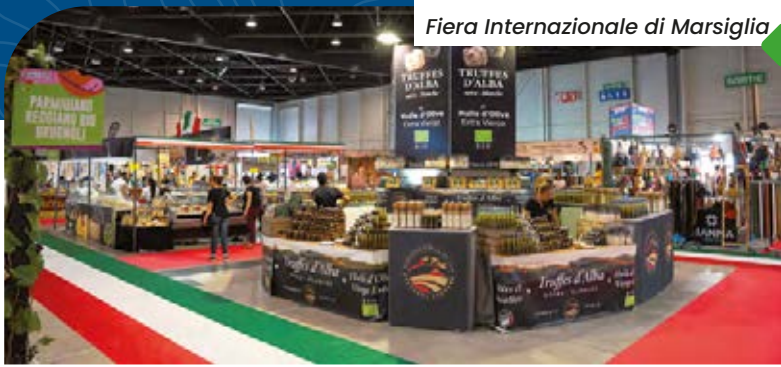
Fiera Internazionale di Marsiglia