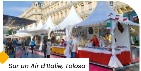
Sur un Air d'Italie, Tolosa