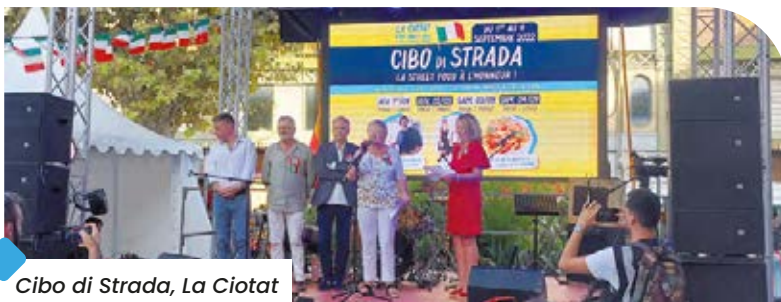
Cibo di Strada, La Ciotat